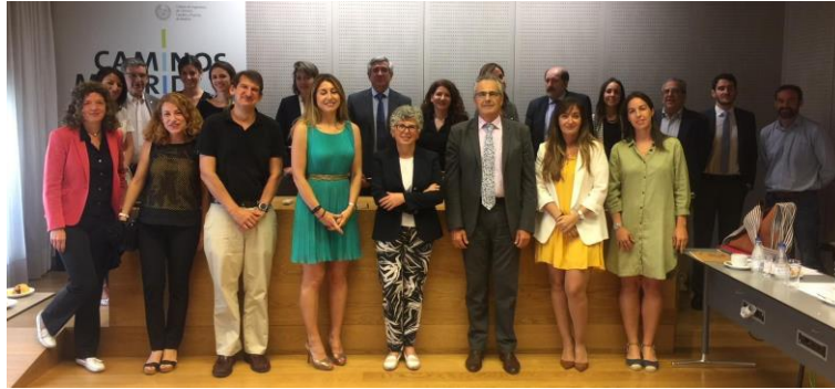
Participantes en el Foro de la Ingeniería y la Cooperación

El pasado 28 de junio, Yakaar África ha participado en el foro de ingeniería y cooperación celebrado en la demarcación de Madrid del colegio de ingenieros de caminos.