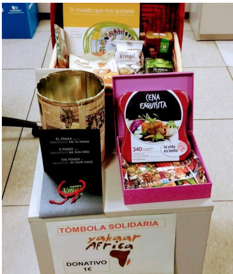
Los productos sorteados en la tómbola solidaria